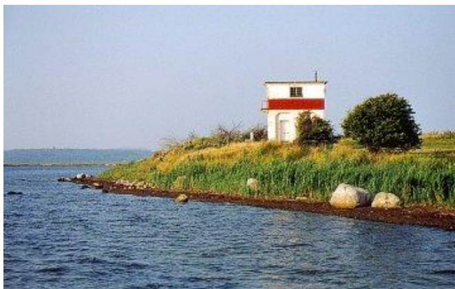
Bogø Fyr set fra syd,

Turen foregår efter sædvanligt koncept, som i hovedtræk består i at vi kører sammen i en til to biler. Vi medbringer ofte hver vores telt, men også tippi på kolde årstider. Tøj og udstyr er specificeret i pakkedliste. Vi har mindst en GPS. laminerede kort udleveres til alle deltagere.